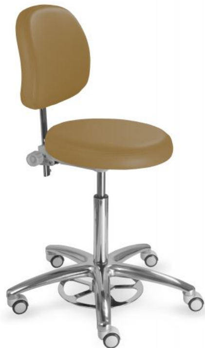
Ilustrační foto (mechanika):